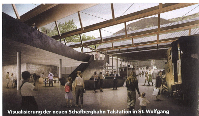
Visualisierung der neuen Schafbergbahn Talstation in St. Wolfgang